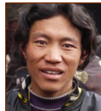
Responsable du Poste de soins