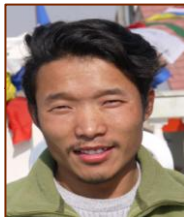
Directeur de CMS